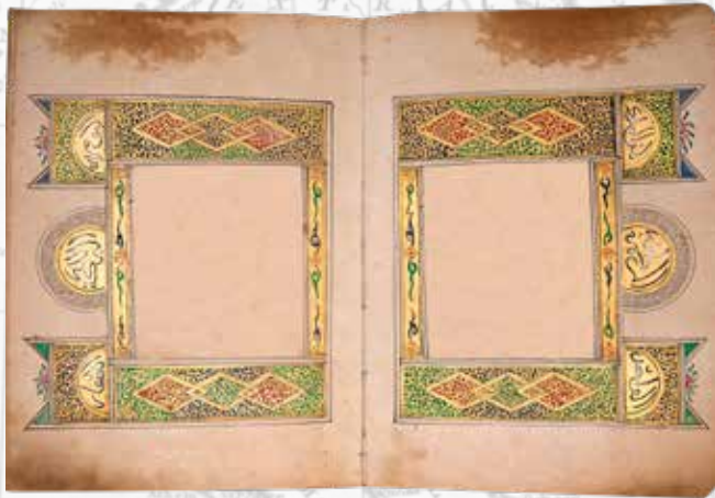
Contoh ragam hias Al-Quran China