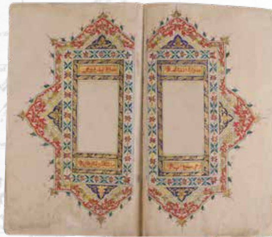
Contoh ragam hias Al-Quran Melayu